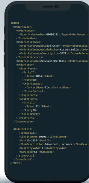
Generierte XML Datei